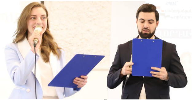
խանները, և նրանցից շատերը համալսարանից հեռացան հստակ կողմնորոշված:

Ամենամյա փառատոնն ամփոփվեց ապրիլի 13-ին, փառատոն, որի յուրաքանչյուր օրը հազեցած էր մասնագիտական կողմնորոշման ուղղված հետաքրքիր հանդիպումներով, վարպետության դասերով, ինտերակտիվ ծրագրերով, ազգային պարերի ուսուցմամբ: Փառատոնը դպրոցականներին աննկարագրելի անմոռանալի օրեր պարզեց: Նրանք մոտիկից ծանոթացան համալսարանի մասնագիտություններին, հետաքրքրությունների շրջանակում ստացան իրենց հուզող հարցերի պատաս-