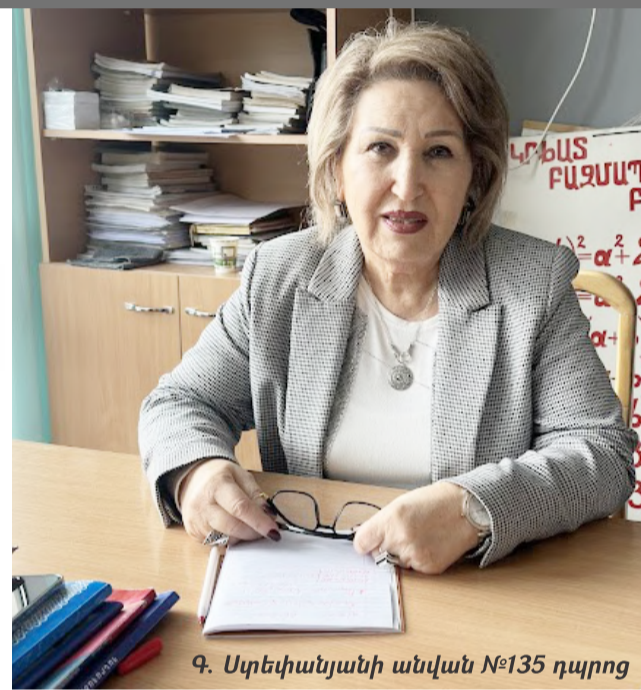
Գ. Ստեփանյանի անվան N°135 դպրոց

Այսօր էլ նա նույն եռանդով մտնում է դասարան, կավիճը վերցնում ձեռքը և սկսում իր հերթական կախարհանքը՝ մաթեմատիկայի դասը: Նրա ներկայությունը N°135 դպրոցում կրթության որակի և մարդկային բարձր արժեքների երաշխիքն է: