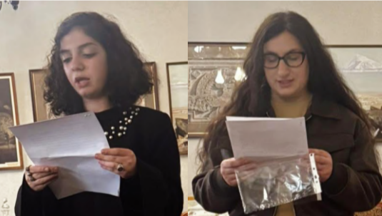
նուրը: Տազնամյն էր դրդել, թե անապական սերը... Հիմա նուրը, Արցախն իր մեջ ամփոփած, մնացել է Սիլվայի սեղանին...

Արի ու տես՝ այս կինը մարգարե էր... Լավ, ինչ էր մտքով անցել, որ չէր կտրել Արցախից նվեր ստացած