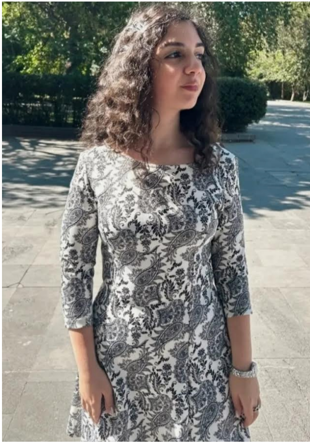
Բոլոր ճանապարհները տանում են դեպի... մանկություն: Գնանք հետ՝ երևակայելով, թե ժամանակի մեքենա ունենք: Ես այն բախտավոր երեխան եմ, որին