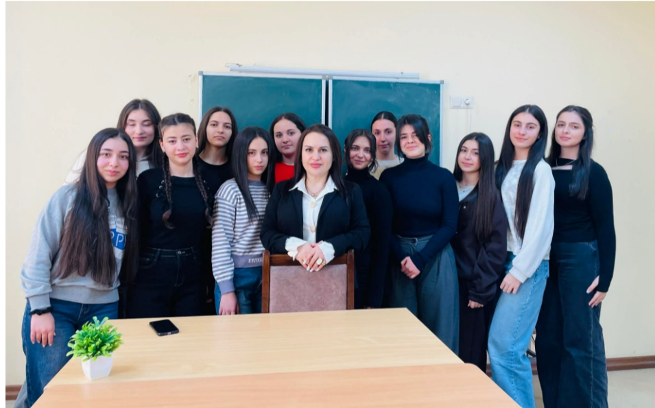
Նկատմամբ: -Դպրոցից դուրս ինչ նախասիրություններ ունեք: -Դպրոցից դուրս ես շատ եմ սիրում