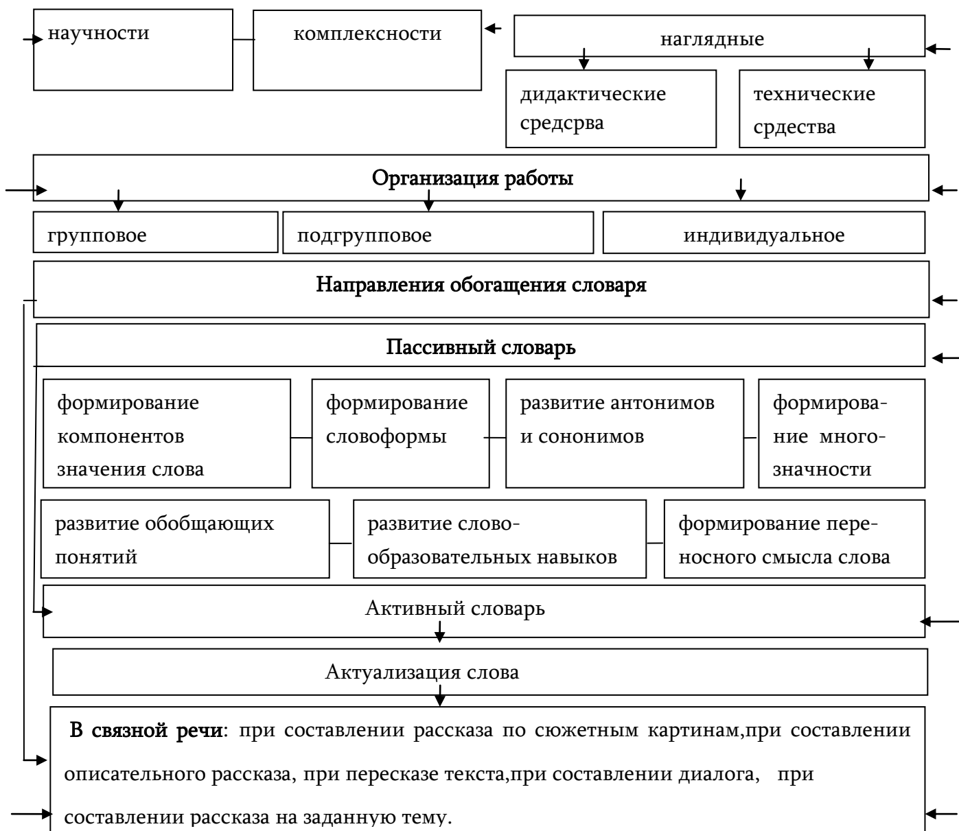
Схема 1. Примерная система логопедической работы по обогащению словаря старших дошкольников с общим недоразвитием речи

Теоретический уровень базируется на лингвистических и психолингвистических теориях формирования и развития словаря, а также на основных логопедических подходах развития словаря. Организационный уровень предполагает подбор видов организации логопедической работы, соблюдение соответствующих принципов в логопедической работе, применение соответствующих методов и средств логопедической работы по обогащению словаря.