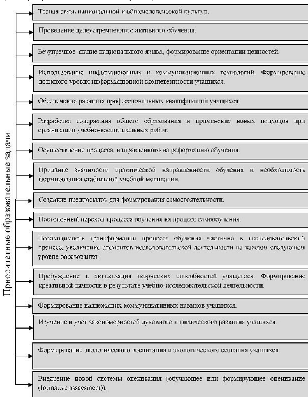
Рисунок 1. Приоритетные образовательные задачи

что в свою очередь приводит к глубоким и значительным изменениям, инновациям и реформам системы образования. Всего этого процесса не могут избежать также страны постсоветского пространства, в том числе и Армения.