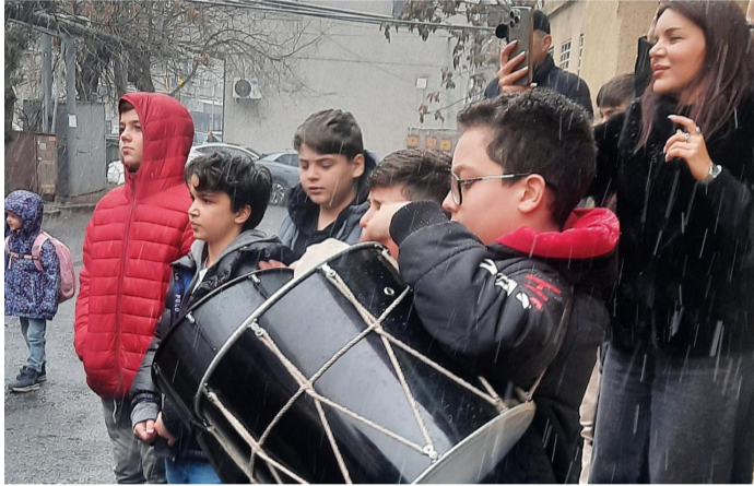
Տեառն ընդառաջի տոնը նշեցին նաև համալսարանական N 57 դպրոցում: