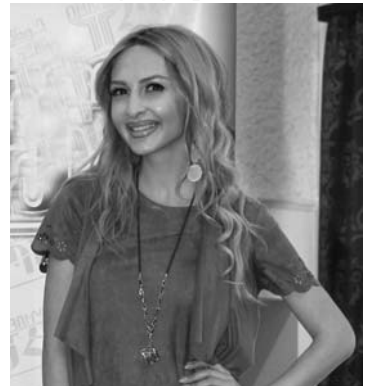
Անահիտ Արզումանյան Գեղարվեստական կրթության ֆակուլտետ