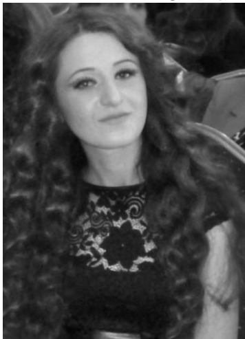
Աննա Սարգսյան Բանասիրական ֆակուլտետ