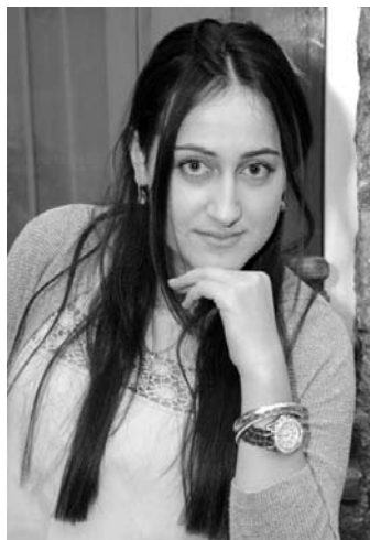
Արփի Ամիրադյան Կուլտուրայի ֆակուլտետ