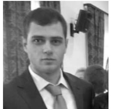
Հմայակ Հարությունյան Պատմության և հրավագիտության ֆակուլտետ

Ուսանողներին շնորհավորեց ՀՀ ազգային ժողովի նախագահ, ՀՊՄՅ խորհրդի նախագահ Գալուստ Սահակյանը: Աժ նախագահն ընդգծեց, որ երկրի նախագահը մեծ ուշադրություն է դարձնում կրթության և գիտության ոլորտին, և ուսանող երիտասարդների ներկա մրցանակաբաշխությունն էլ դրա >3