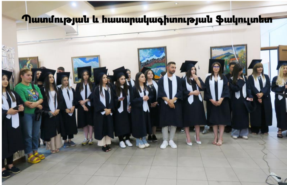
Պատմության և հասարակագիտության ֆակուլտետ