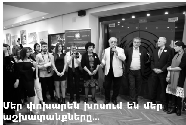
Մեր փոխարեն խոսում են մեր աշխատակիցները...

- Խոսել միայն Հայաստանի մասին այսօր, այնքան էլ կոռեկտ չի լինի, որովհետև համաշխարհային այնպիսի գործընթաց է տեղի ունենում, որ ակնհայտորեն ամբողջ մոլորակը և մարդկությունը էկոլոգիական ճգնաժամի մեջ են: Աշխարհի ամենահայտնի գիտնականներն առաջին անգամ 1971 թվականին դիմեցին ՄԱԿ-ին՝ բարձրաձայնելով համաշխարհային էկոլոգիական ճգնաժամի ձևավորման մասին, որպեսզի միջոցներ ձեռնարկվեն: Առաջին հավաքը ՄԱԿ-ի մակարդակով եղել է Ստոկհոլմում: 1972թ.-ին հարցը քննարկվել է այնտեղ, ստեղծվել է հատուկ հանձնաժողով Լոբովեգիայի վարչապետի ղեկավարությամբ, ուսումնասիրվել է իրավիճակը մոլորակի վրա և տպագրվել է հետաքրքիր գիրք-գեկոյց՝ «Մեր ընդհանուր պագան», որտեղ փաստվել է՝ այո, մոլորակը և ամբողջ աշխարհի մարդկությունը էկոլոգիական ճգնաժամի մեջ են՝ պետք է ծրագրեր մշակվեն > 4